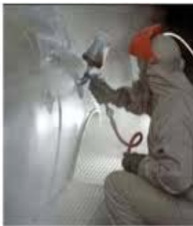
Figure 1 Now you see it