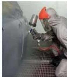
Figure 2 Now you don't