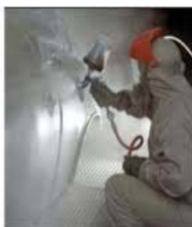
Figure 1 Now you see it