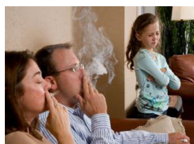
Il Fumo di Sigarette attivo e passivo