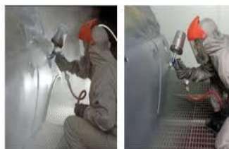
Figure 1 Now you see it